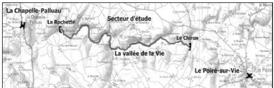
Le secteur d'étude proposé est constitué du cours de la Vie et des terrains bordant la rivière entre les lieux-dits Le Chiron à l'est et La Rochette à l'ouest, soit environ 8 km d'une belle vallée bocagère.