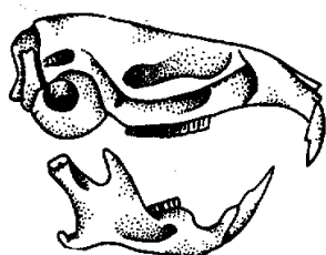
Campagnol agreste Microtus agrestis