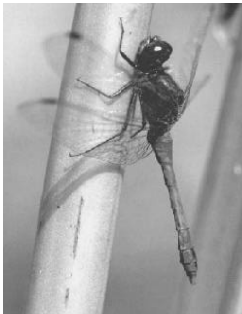
Sympetrum sanguineum (mâle)

Gilbert BESSONNAT : tél & fax 02 51 90 27 48