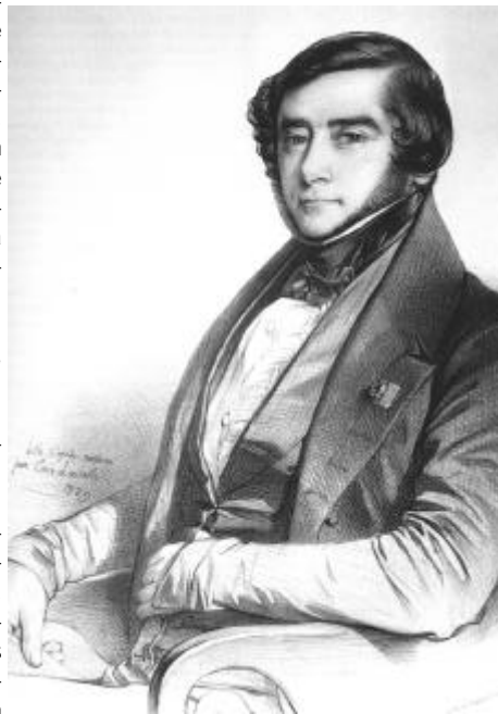
Alcide d'Orbigny à 27 ans, gravure d'Émile Lassalle, lithographie de Lavallée (1839).

- cédérom Le voyage d'Alcide d'Orbigny (1802-1857), Amérique