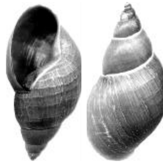
Stagnicola sp., L = 16 mm, le 27/04/1998, Saint-Denis-du-Payré (85), collection C.GOYAUD

Les exemplaires de Stagnicola récoltés à Nalliers (dans la réserve le 24/09/2001), à Courdault (le 15/05/2002), à Sainte-Gemme-la-Plaine (Pont de Silly, le 14/05/2002) et à Olonne-sur-Mer (marais des Bourbes, le 30/03/2003) présentent tous la même coupe de la prostate qui prouve qu'il s'agit bien de Stagnicola fuscus .