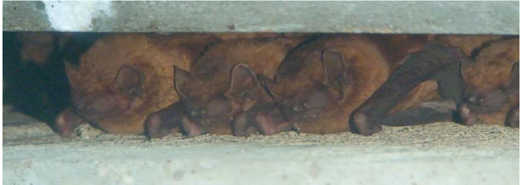
Noctules communes ( Nyctalus noctula ) sous un pont à Montaigu