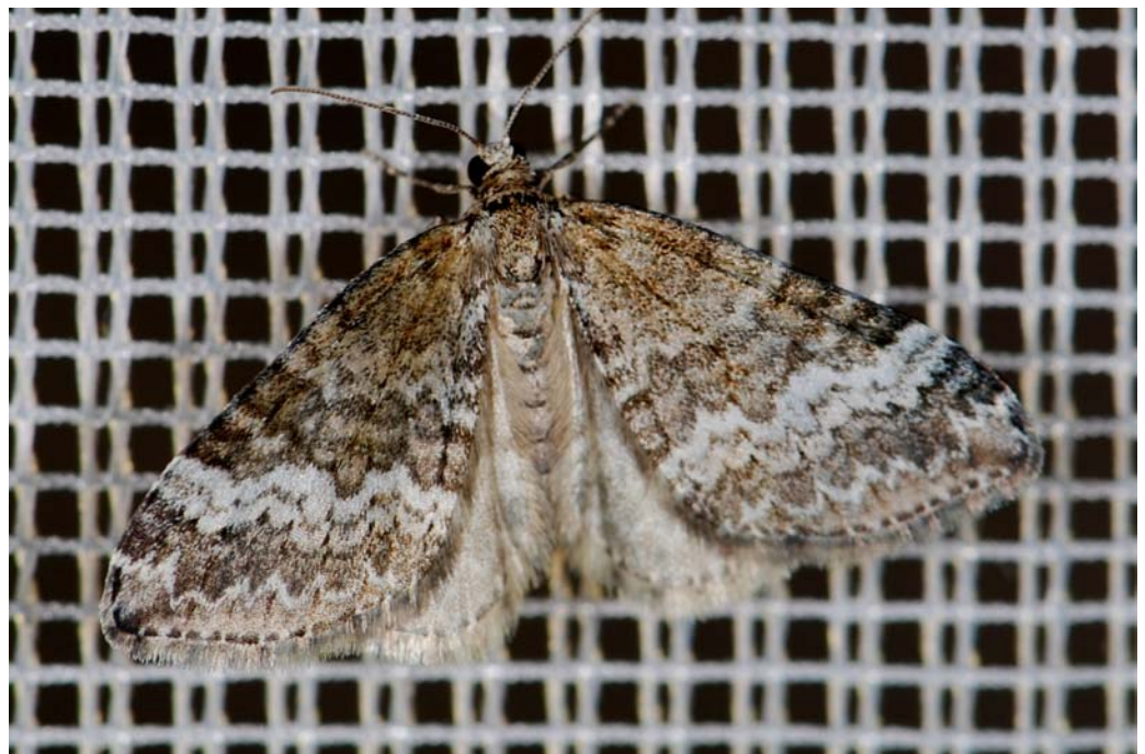
Perizoma hydrata (Treitschke, 1829), envergure : 15 à 25 mm