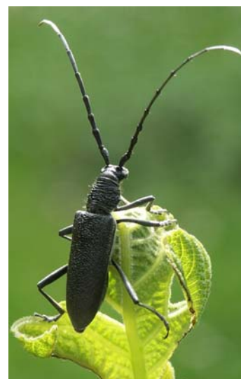
Inventaire des Coléoptères Cerambycidae de Vendée

Association La Cicadelle La Boirie, 85190 Aizenay